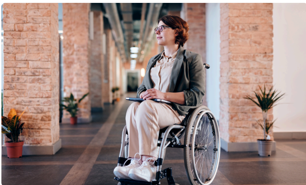
JOURNÉE DE LA SCLÉROSE EN PLAQUES