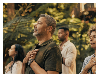
SEMAINE DE LA QVT