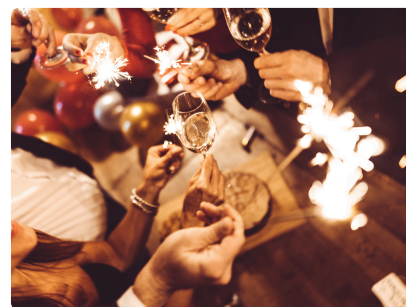
SOIRÉE DE FIN D'ANNÉE