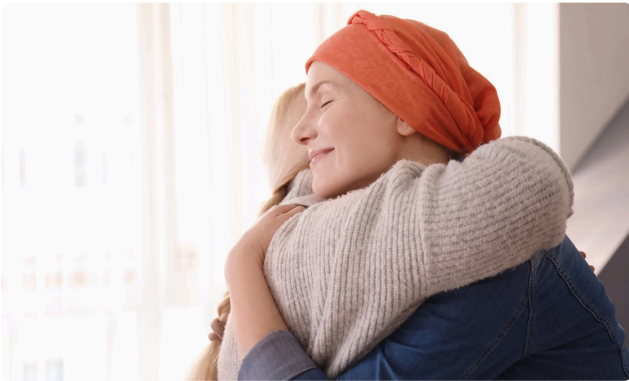
JOURNÉE MONDIALE DE LUTTE CONTRE LE CANCER