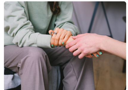
JOURNÉE DE LA SANTÉ MENTALE