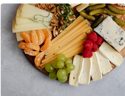
AFTER WORK DE RENTRÉE