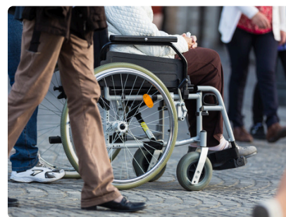
SEMAINE DU HANDICAP