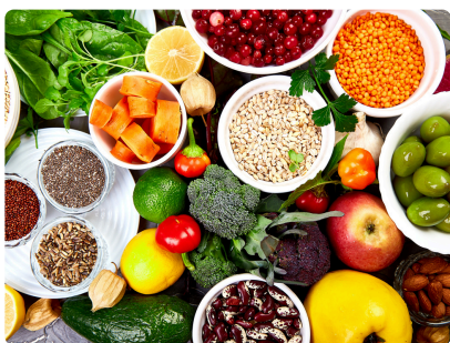
SEMAINE DU GOÛT