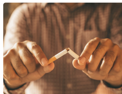
JOURNÉE MONDIALE SANS TABAC