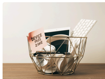
JOURNÉES MONDIALES SANS TÉLÉPHONE PORTABLE