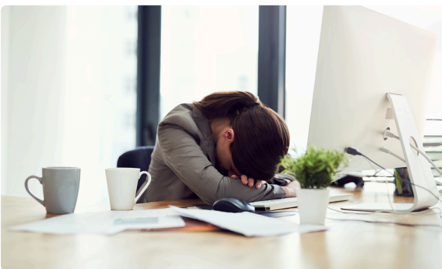
PRÉVENTION DES RPS / BURN-OUT