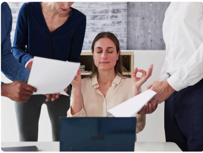
GESTION DES CONFLITS