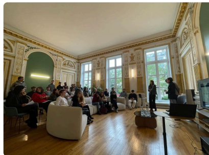
VULNÉRABILITÉS ET RÉSILIENCE