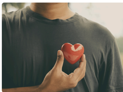
JOURNÉE MONDIALE DE LA SANTÉ