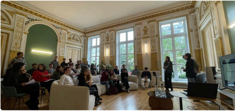
JOURNÉE INTERNATIONALE DES DROITS DES FEMMES

La Journée internationale des droits des femmes du 8 mars est l'occasion de promouvoir l'égalité des sexes au sein de son entreprise, en sensibilisant l'ensemble des collaborateurs aux enjeux de la parité et de l'inclusion