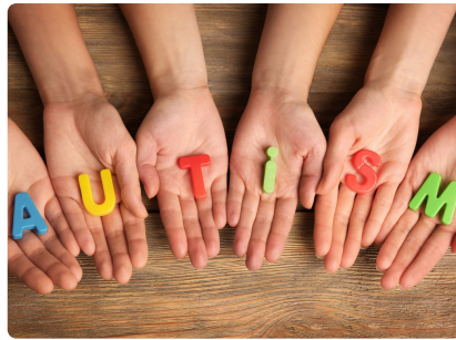
SENSIBILISATION À L'AUTISME