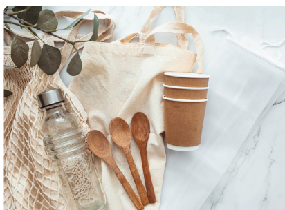
PLATEAU REPAS ZÉRO DÉCHET