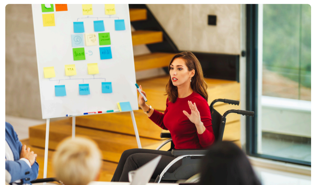
JOURNÉE MONDIALE DES PERSONNES HANDICAPÉES