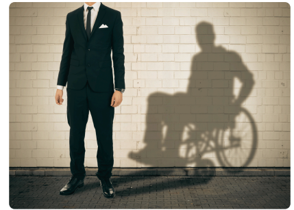
JOURNÉE DE LA FIBROMYALGIE