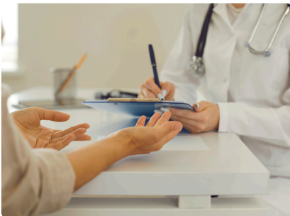
JOURNÉE MONDIALE DE LA SANTÉ