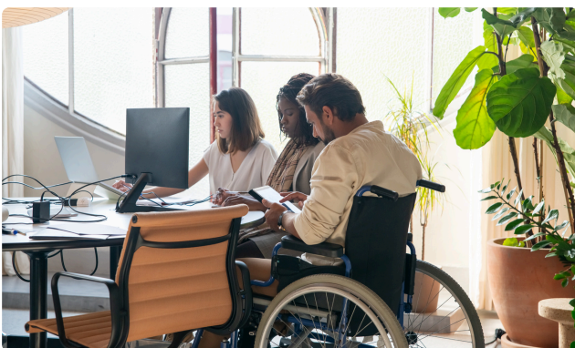
SEMAINE POUR L'EMPLOI DES PERSONNES HANDICAPÉES