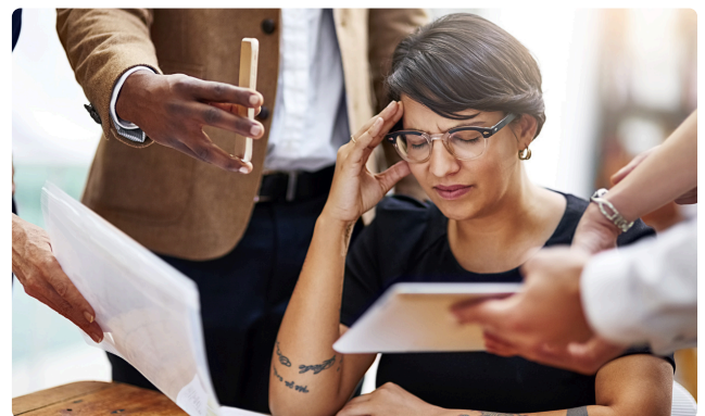
GESTION DU STRESS ET DES ÉMOTIONS