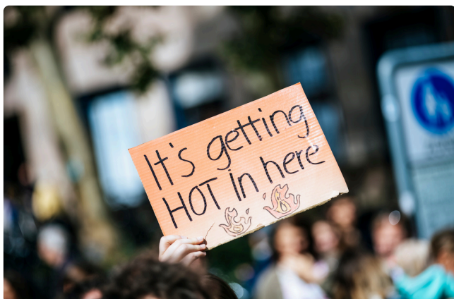
ATELIER FRESQUE DU CLIMAT

Atelier d'intelligence collective basé sur le rapport du GIEC pour comprendre les enjeux climatiques